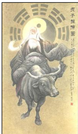
Laotse, legendärer Begründer des Daoismus und Verfasser des Daodejing

Unter Alchemie versteht man im Allgemeinen einen Prozess der Umwandlung, Verfeinerung oder Veredelung. Die innere Alchemie (chin. „Nei Dan Gong“) ist das praktische Schulungssystem der größten daoistischen Schule Chinas, dem so genannten Quan Zhen Dao (Weg der vollständigen Verwirklichung). Es versteht sich als Weg der persönlichen Kultivierung und Heilung von Körper, Geist und Seele im Einklang mit den Gesetzen der (menschlichen) Natur.