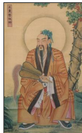
Wang Chong Yang

Jede dieser vier Trainingsstufen verfügt über eine eigene tiefgründige